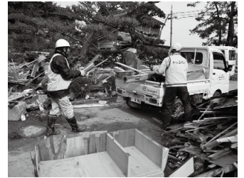
災害後のボランティア活動 (能登半島地震災害ボランティア)