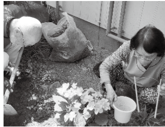
くらしのボランティア (くらし応援隊)