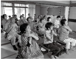
多世代交流の居場所づくり (おとなりカフェ)