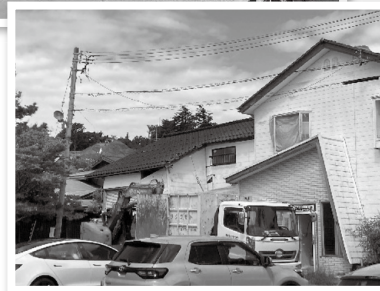
写真 (上)更地となった輪島朝市 (下)至る場所で家屋の解体が続く