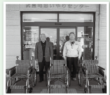
ご寄付いただいた物の一部