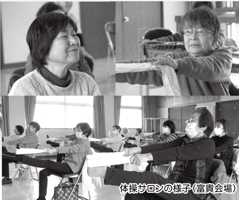
体操サロンの様子(富貴会場)