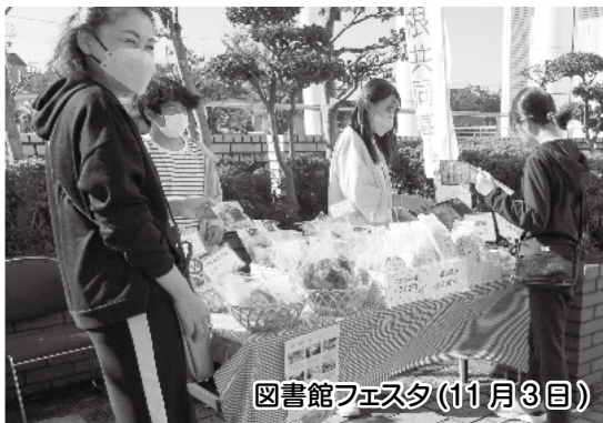
図書館フェスタ(11月3日)