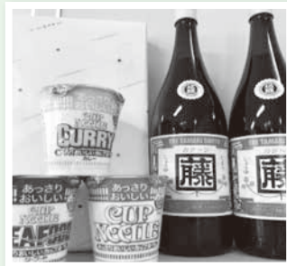
調味料・カップラーメン