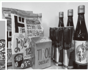
調味料 インスタント味噌汁